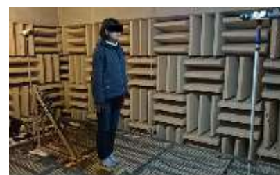
障害物知覚の実験風景

視覚障害者の一部が持つ, 音を出さない障害物の存在を知ることができる「障害物知覚」能力について調べている. いろいろな環境下でその能力の要因や適用範囲について明らかにすることで, このような能力の獲得訓練などに役立てることを狙って研究を行っている