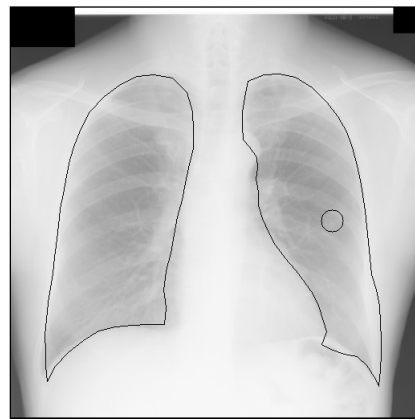
(b) 肺境界検出の結果